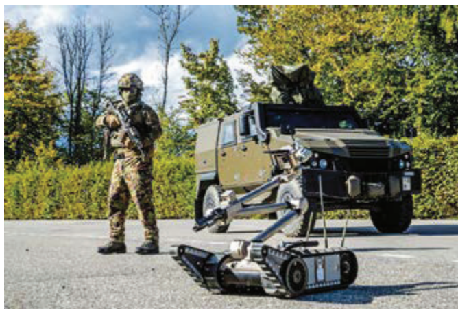
Ci-dessous : Spécialiste DEMUNEX devant véhicule d'exploration DEMUNEX et manipulateur.