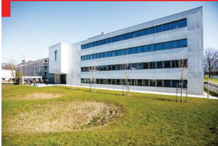
Le centre de compétences NBC-DEMUNEX à Spiez.