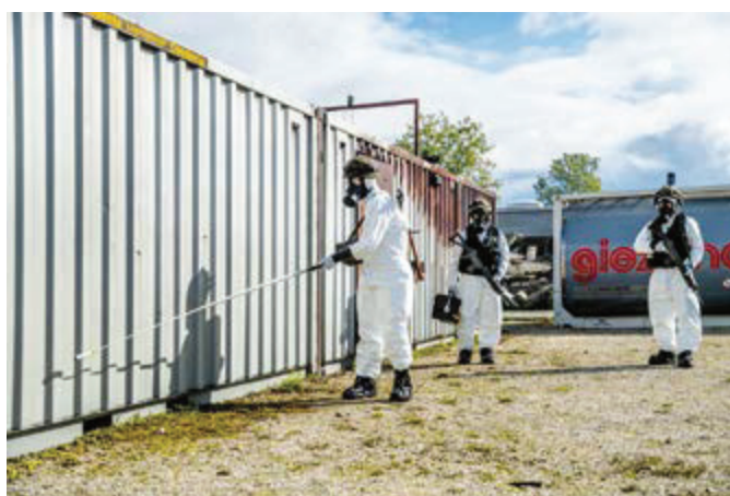
Ci-dessus : Groupe de prélèvement des échantillons en action.