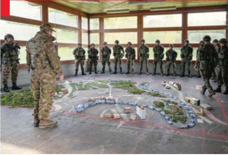
Ci-contre et page suivante: Entraînement au combat en zones urbaines (CEZU).